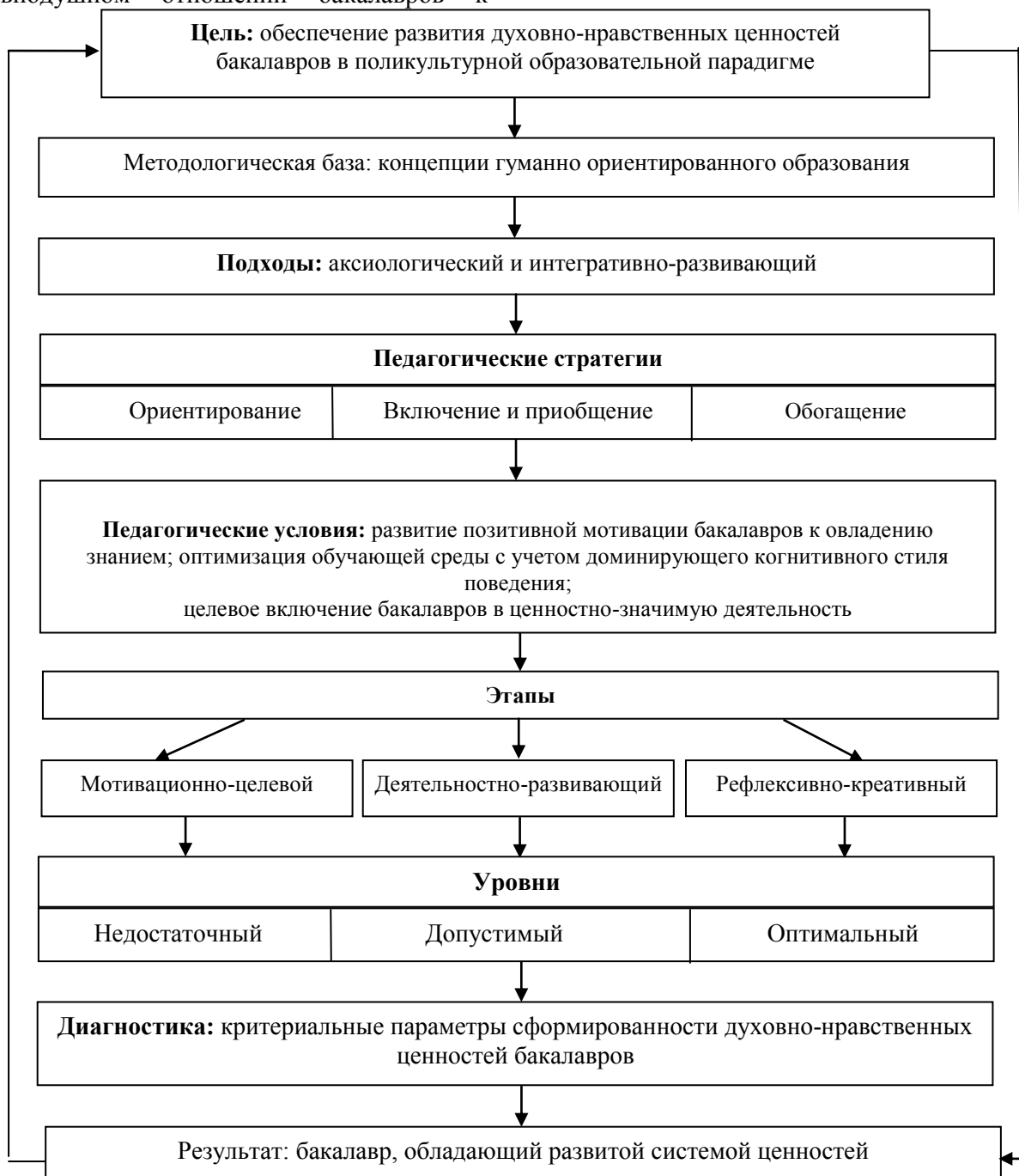
Рисунок 1 – Формирование духовно-нравственных ценностей бакалавров в поликультурной образовательной парадигме

своему окружению, отсутствию готовности и способности к сопереживанию, слабой социальной