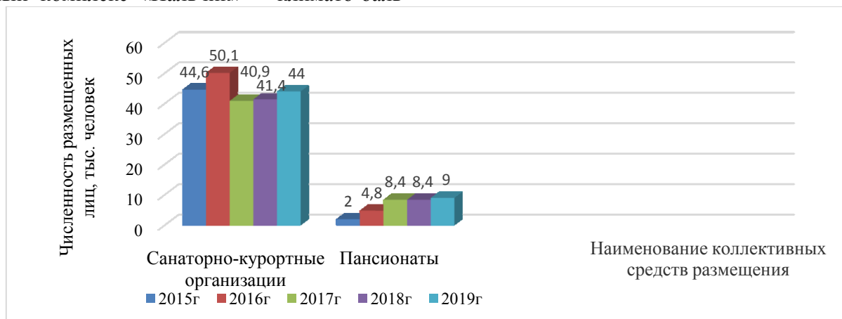
Рисунок 2 – Динамика численности размещенных лиц, тыс. человек

неологический грязевой курорт, расположенный в Кабардино-Балкарии (500-555 м над уровнем моря), в наиболее благоприятной для климата среде города Нальчик – Долинск [9].