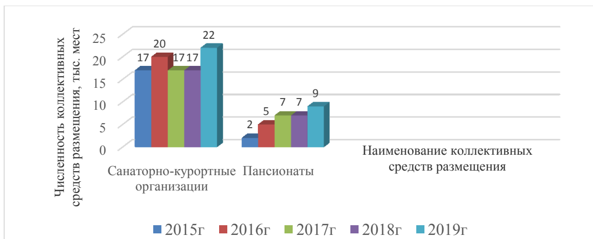
Рисунок 1 – Динамика численности коллективных средств размещения тыс. мест

В 2019 году численность коллективных средств размещения в санаторно-курортных организациях составила 22 тыс. мест против 17 тыс. мест в 2015 году, в пансионатах наблюдается увеличение этого показателя почти в 5 раз [7] (рис. 1).