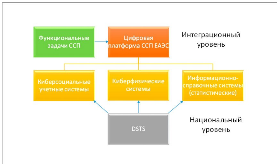
Рисунок 4 – Архитектура цифровой платформы поддержки системы стратегического планирования АПК

Область применения результатов исследования. Предложения, рекомендации и разработки имеют большое теоретическое и практическое значение для системы стратегического планирования, при составлении, реализации и оценке эффективности целевых комплексных программ в аграрной сфере.