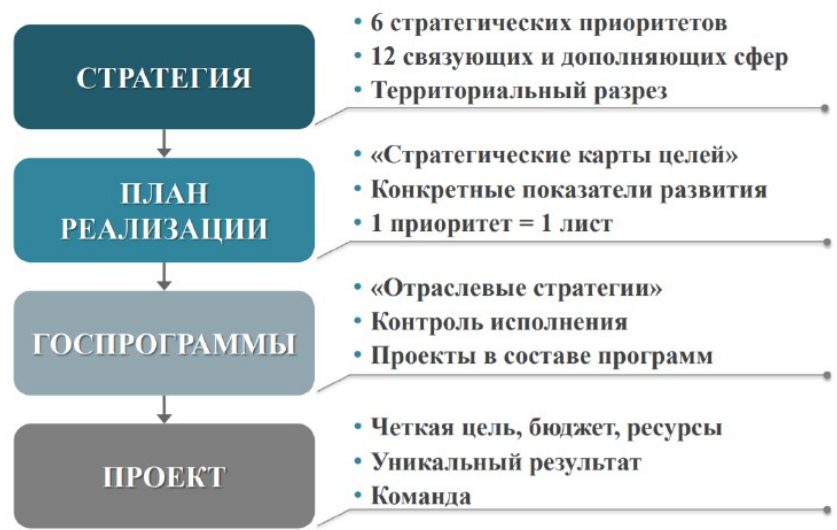
Рисунок 2 – Схема реализации стратегий развития АПК

поскольку наполняемость бюджетов и так низка и в этих регионах отсутствует такой ключевой инструмент управления, как фискальный.