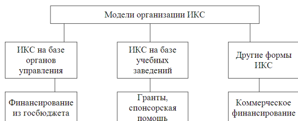
Рисунок 1 – Источники финансирования моделей организации ИКС

Как уже известно, существует несколько моделей организации ИКС (рис. 1):