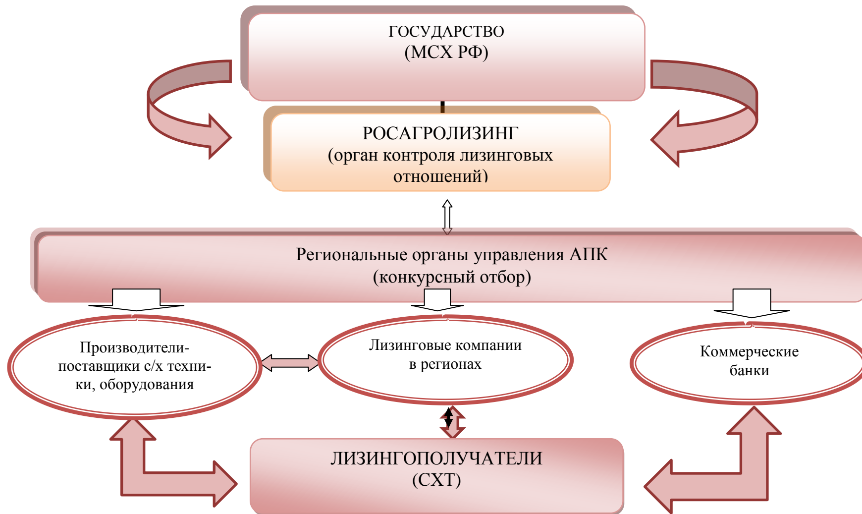
Рисунок 2 – Совершенствование механизма агролизинга