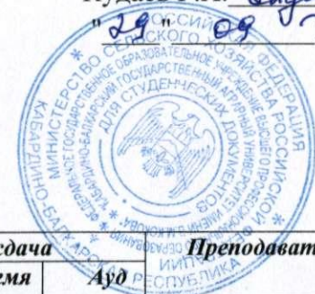
ГРАФИК сдачи зачетов и экзаменов направление подготовки 100400.62 - «Туризм» заочной формы обучения 2014-2015 учебного года (осенний семестр) 4 курс