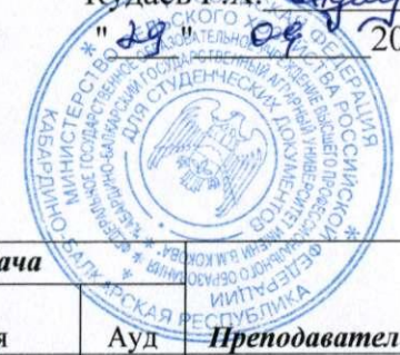
ГРАФИК сдачи зачетов и экзаменов направление подготовки 100400.62 - «Туризм» заочной формы обучения 2014-2015 учебного года (осенний семестр) 2 курс